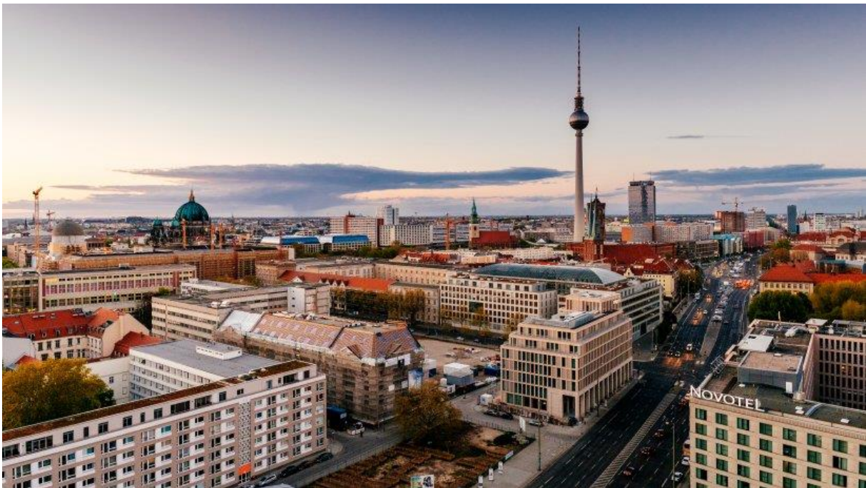
Stadtansicht von Berlin